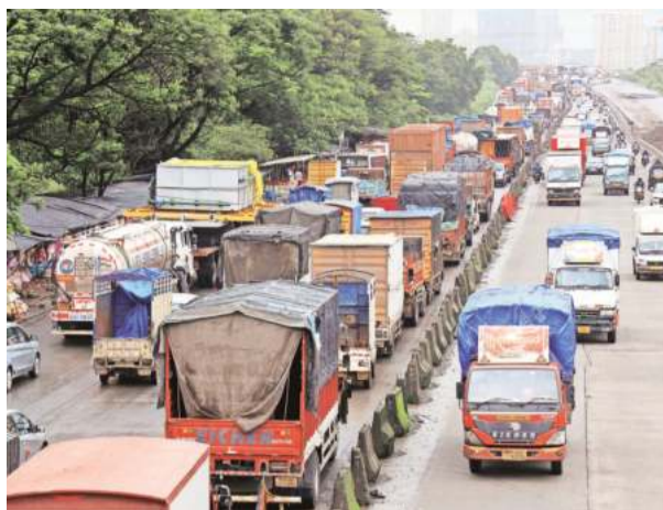
LONG WAIT: Vehicles stuck in traffic on Mumbai-Nashik highway on Wednesday. Deepak Joshi