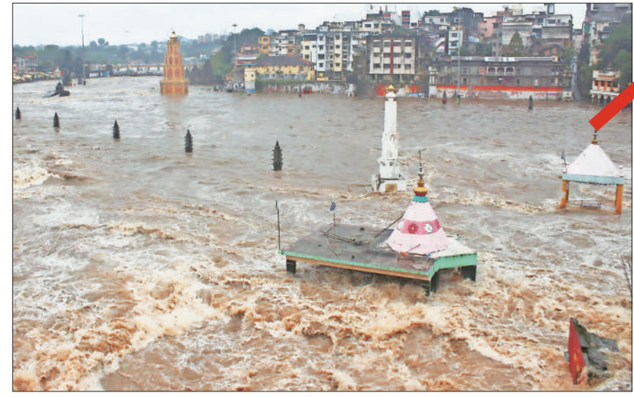
नाशिक येथे गंगापूर धरणातून सोडण्यात येणाऱ्या पाण्यामुळे गोदावरीच्या पातळीत वाढ झाली आहे. नदीपात्रातील काही मंदिरांमध्ये पाणी शिरले आहे.