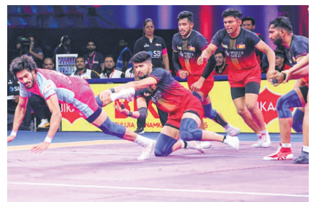
Jaipur Pink Panthers raider finds himself in trouble against Bengaluru Bulls defenders in Jaipur on Friday.