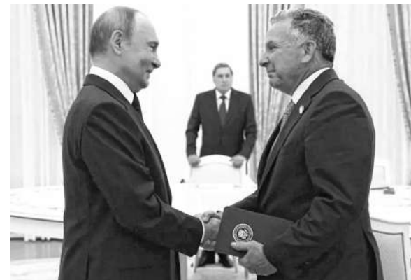
Russia's President Vladimir Putin greets US special envoy Steve Witkoff prior to their talks in Moscow