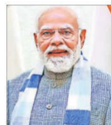
The PM interacted with government secretaries, and discussed ease of doing business and ease of living

The secretaries highlighted ongoing efforts to enhance the prime minister's vision into actionable outcomes, while also discussing sector-specific challenges and outlining their future strategies to enhance