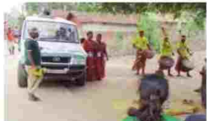
অর্চনার মধ্য দিয়ে বুদ্ধ পূর্ণিমায় বা শিকার উৎসব পালন করতে হবে। তাই মাইকিং এর মাধ্যমে সচেতনতার প্রচার করা হচ্ছে।

দণ্ডনীয় অপরাধ। তাই এই শিকার উৎসবে জঙ্গলের কোন বনাশ্রমী হত্যা করা যাবে না। শুধু মাত্র পূজা