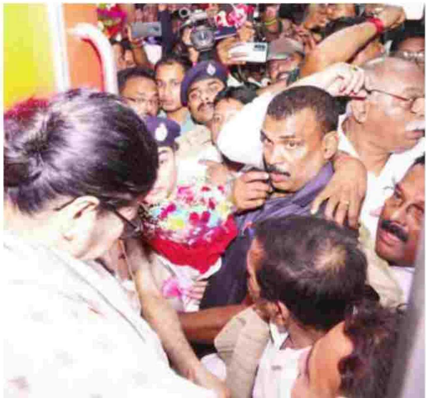
মালদা সফরে যাওয়ার পথে ট্রেন বোলপুরে দাঁড়াতেই মুখ্যমন্ত্রী মমতা বন্দ্যোপাধ্যায় বীরভূম জেলার তৃণমুলের নেতা কর্মীদের সঙ্গে আলোচনা করলেন কিছুক্ষণ।