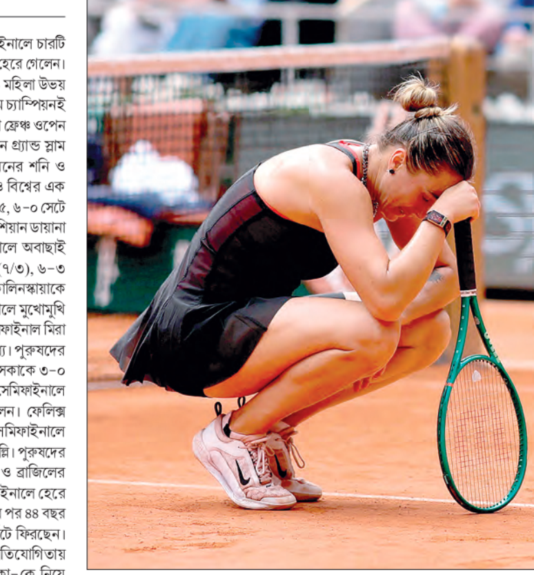
হেরে কোর্টেই মাথা নত আরিনা সাবালেঙ্কার।

বৃহস্পতিবার মহিলাদের কোয়ার্টার ফাইনালে চারটি গ্র্যান্ড স্ল্যাম জয়ী আরিনা সাবালেঙ্কার হেরে গেলেন। ফলে এবার ফ্রেঞ্চ ওপেনে পুরুষ ও মহিলা উভয় সেমিফাইনালে কোনও গ্র্যান্ড স্ল্যাম চ্যাম্পিয়নই থাকছেন না। নতুন পুরুষ ও মহিলা ফ্রেঞ্চ ওপেন চ্যাম্পিয়ন পাওয়াই নয়, দুই নতুন গ্র্যান্ড স্ল্যাম চ্যাম্পিয়নও পাওয়া নিশ্চিত সামনের শনি ও রবিবার। মোরোদের শীর্ষ বাছাই ও বিশ্বের এক নম্বর সাবালেঙ্কারকে এদিন ৩-৬, ৭-৫, ৬-০ সেটে হারিয়ে বিরাট অঘটন ঘটালেন রাশিয়ান ডায়ানা কস্টার্নিক। অন্য কোয়ার্টার ফাইনালে অবাছাই পোলিশ মাজা চোয়ালিনস্কা ৭-৬ (৭/০), ৬-৩ সেটে সেটে ২২ নম্বর বাছাই আনা কালিনস্কায়াকে হারান। বৃহস্পতিবার সেমিফাইনালে মুখোমুখি মাইডার ও চোয়ালিনস্কা। অন্য সেমিফাইনালে মিরো আন্ড্রিভা ও মার্তা কস্তিউকের মধ্যে। পুরুষদের কোয়ার্টার ফাইনালে জোয়াও ফনসেকাকে ৩-০ সেটে সেটে হারিয়ে জাকুব মেনসিক সেমিফাইনালে আন্ড্রে জেরেভের মুখোমুখি হলেন। ফেলিক্স আগারকে ৩-১ সেটে হারিয়ে সেমিফাইনালে উইলেন ইতালির ফ্র্যাভিও কোবোলি। পুরুষদের ডাবলসে ভারতের এন বালাজি ও হাজিলের ডেমোলিনারের জুটি কোয়ার্টার ফাইনালে হেরে গেছে। এদিকে, অবসরের চার বছর পর ৪৪ বছর বয়সে সেরেনা উইলিয়ামস সার্কিটে ফিরছেন। আসম কুইস ক্লাব গ্রাসকোর্ট প্রতিযোগিতায় ১৯ বছরের ডিস্টেরিয়া এমবোকো-কে নিয়ে সেরেনা ডাবলসে খেলবেন।