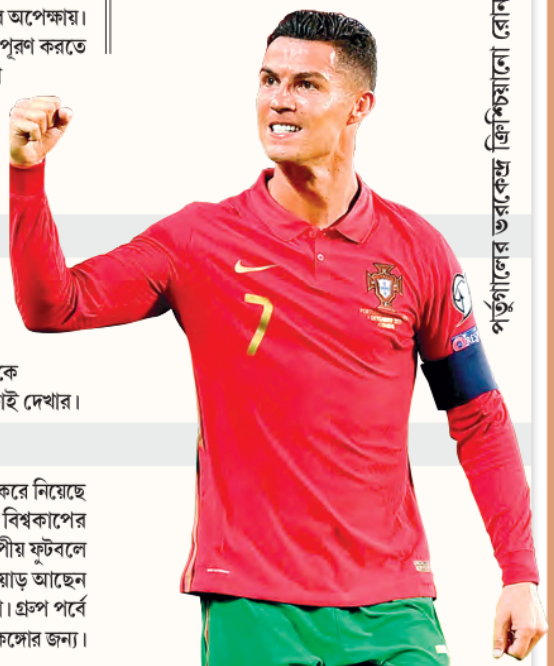
পর্তুগালের ডার্লিং ক্রিস্টিয়ানো রোনাল্ডো

মার্কিন মেজাজে ফুটবল খেলার জন্য খ্যাত দক্ষিণ আমেরিকার এই দেশটি। কাতার বিশ্বকাপে খেলার যোগ্যতা অর্জন করতে পারেনি কলম্বিয়া। এবার তারা ফিরে এসেছে বিশ্ব ফুটবলের সবচেয়ে বড় মঞ্চে। গ্রুপ পর্বের প্রথম দুটি ম্যাচ মেক্সিকোয় খেলবে কলম্বিয়া। দলে আছেন বার্মান মিউনিখের তারকা ফুটবলার লুই দিয়াজ।