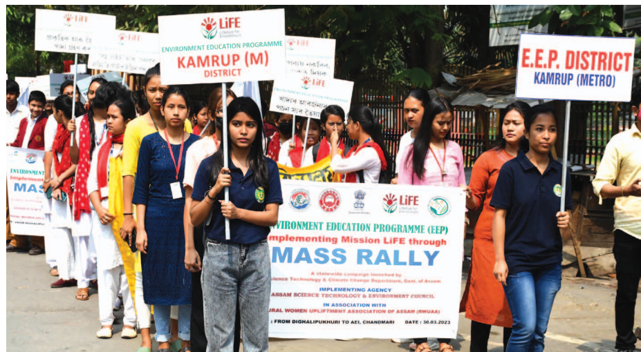
ওৱাহাতীত পৰিবেশ শিক্ষা কাৰ্যসূচীৰ সজাগতা বেলীত অংশগ্ৰহণ কৰা ছাত্ৰ-ছাত্ৰীৰ একাংশ, বৃহস্পতিবাৰে