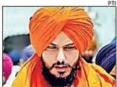
Amritpal came to Punjab from UP's Lakhimpur Kheri, cops say