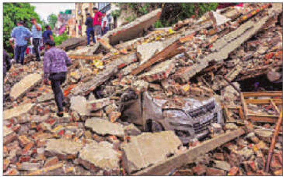
इमारत के ढहने के बाद राहत एवं बचाव कार्य में जुटी एनडीआरएफ की टीमों और मलबे के ढेर में दबा एक वाहन।