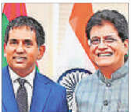
Union Minister Piyush Goyal with Mohamed Saeed, minister of economic development, transport and trade of the Maldives, on Wednesday

Goyal said that the relationship between the people and the businesses of the two countries is soon going to get another fillip with the signing of a BIT and later an FTA.