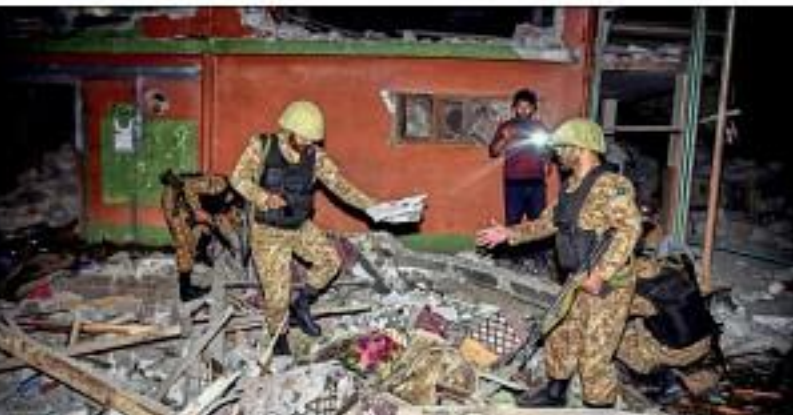
भारतीय सेना ने पाकिस्तान में आतंक के ठिकाने किए नष्ट

एक भारत-श्रेष्ठ भारत की गर्जना को ऑपरेशन सिंदूर के जरिए पूरी दुनिया ने सुन लिया। पाकिस्तान स्थित नौ आतंकी ठिकानों को भारत की स्वदेशी मिसाइलों ने निशाना बनाया तो पाकिस्तान कार्रवाई से रोकने के लिए गिड़गिड़ाने लगा। प्रधानमंत्री नरेंद्र मोदी के नेतृत्व एवं भारतीय सेना के पराक्रम की जगलबंदी से दुनिया के नज़े-नज़े देश हैरान रह गए। आतंक के खिलाफ सटीक कार्रवाई ने बदले हुए अजानत, समर्थ तथा स्वदेशी तर्कनैक से लड़ने वाले भारत का चेहरा दुनिया के सामने प्रकट किया।