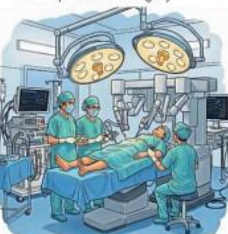
Knee replacement surgery

दिल्ली के डॉक्टरों ने एक बार फिर बड़ा करनामा किया है। इस बार मैक्स सुपर स्पेशलिटी हॉस्पिटल साकेत के आर्थोपेडिक डिपार्टमेंट के डॉक्टरों ने दुनिया की पहली रोबोट असिस्टेड सोमेटोलेस मीडियल पिण्ड नी रिप्लेसमेंट की सफल सर्जरी की है। डॉक्टरों का दावा है कि पहली बार इस तरह की सर्जरी की गई है। झारखंड के धनबाद निवासी 52 साल के मरीज की इस तकनीक की मदद से सर्जरी की गई है। वह पिछले आठ वर्षों से घुटने के गंभीर दर्द और अन्य समस्याओं से जूझ रहे थे।