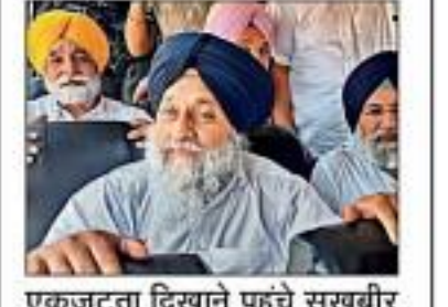
एकजुटता दिखाने पहुंचे सुखबीर बादल और अन्य हिरासत में।

भाषा, चंडीगढ़: मोहाली की एक अदालत ने बुधवार को शिरोमणि अकाली दल के नेता विक्रम सिंह मजीठिया की हिरासत चार दिन के लिए बढ़ा दी। उन्हें आय से अधिक संपत्ति मामले में गिरफ्तार किया गया था। बुधवार को सात दिन की सतर्कता ब्यूरो की हिरासत समाप्त होने के बाद मजीठिया को कड़ी सुरक्षा के बीच अदालत में पेश किया गया। ब्यूरो ने 25 जुन को एक FIR दर्ज की थी और 540 करोड़ रुपये के कथित 'ड्रग मनी' (मादक पदार्थ की तस्करी से प्राप्त आय) के लॉन्गिन मामले में मजीठिया को गिरफ्तार किया था।