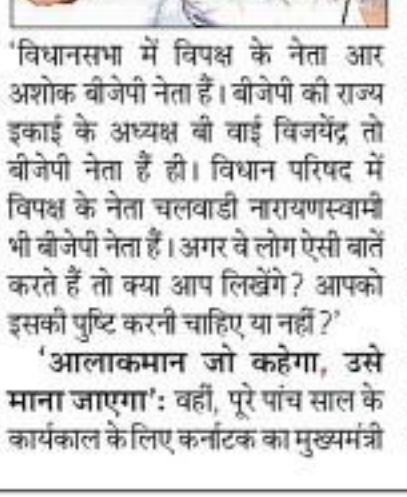
'विधानसभा में विपक्ष के नेता आर अशोक बीजेपी नेता हैं। बीजेपी को राज्य इकाई के अध्यक्ष की वाई विजयेंद्र तो बीजेपी नेता हैं ही। विधान परिषद में विपक्ष के नेता चलेवाडी नारायणस्वामी भी बीजेपी नेता हैं। अगर वे लोग ऐसी बातें करते हैं तो क्या आप लिखेंगे? आपको इसकी पुष्टि करना चाहिए या नहीं?' 'आलाकमान जो कहेगा, उसे माना जाएगा': वहीं, पूरे पांच साल के कार्यकाल के लिए कर्नाटक का मुख्यमंत्री

कर्नाटक के मुख्यमंत्री सिद्धारमैया ने बुधवार को कहा कि वह पांच साल के पूरे कार्यकाल के दौरान पद पर बने रहेंगे। सिद्धारमैया ने कहा कि कोयस एकजुट है और पार्टी की सरकार पांच साल तक 'चट्टान की तरह मजबूत' रहेगी। परकारों ने सिद्धारमैया से सवाल किया कि क्या वह पांच साल तक मुख्यमंत्री रहेंगे जिसके जवाब में उन्होंने कहा, 'हां, मैं रहूंगा। आपको इसमें संदेह क्यों है?' मुख्यमंत्री को बदले जाने संबंधी बीजेपी और जेडीएस नेताओं के दावे को लेकर पूछे गए सवाल के जवाब में सिद्धारमैया ने कहा, 'क्या वे हमारे आलाकमान हैं?' उन्होंने कहा,