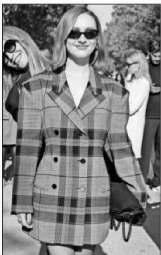
स्टेला मेकार्टनी महिला परिधान फैशन शो में सोमवार को भाग लेती मौड़ अपाटो।

ब्रिटेन में 'संस्थागत नस्लवाद' की एक चौकाने वाली घटना में, नर्सों ने कथित तौर पर एक सिख मरीज की दाढ़ी को प्लास्टिक के दस्ताने से बांध दिया। नर्स ने उसे उसके मूत्र में रहने को मजबूर किया और उसे वह भोजन दिया, जो वह धार्मिक कारणों से नहीं खा सकता था। एक खबर में यह दावा किया गया है। 'द इंडिपेंडेंट' अखबार ने ब्रिटेन की नर्सिंग एंड मिडवाइफरी काउंसिल (एनएमसी) से लीक हुए एक दस्तावेज के हवाले से पिछले सप्ताह खबर प्रकाशित की थी कि व्यक्ति ने अस्पताल में मृत्यु शय्या पर लिखे एक नोट में भेदभाव के बारे में शिकायत की थी, इसके बावजूद नर्सों को काम करने दिया गया। एनएमसी एक नियामक है, जो नर्सिंग स्टाफ और मरीजों के खिलाफ कथित नस्लवाद के कई मामलों का ब्योरा रखता है।