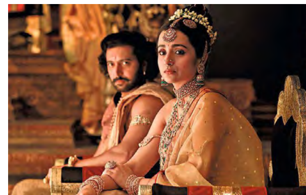
EPIC OPENING. The periodic drama with an ensemble cast is estimated to have released in more than 3,200 screens across the globe. ksl

Industry experts say the absence of major film releases in Bollywood or any other regional movies also means that Ponniyin Selvan 2 will continue to dominate the silver screen for next few weeks.