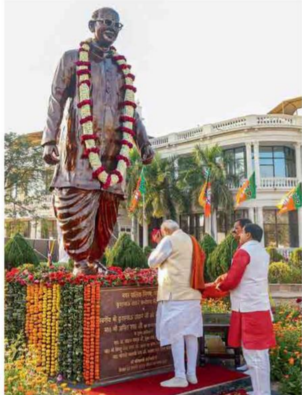
भोपाळ : मध्य प्रदेशाच्या दीनारव असताना पंतप्रधान नरेंद्र मोदी यांनी सोमवारी भाजपचे ज्येष्ठ नेते दिग्विजय कुराभाऊ ठाकरे यांच्या पुतळ्यास अभिवादन केले. या वेळी मुख्यमंत्री मोहन यादव.

भोपाळ, ता. २४ (पीटीआय) : "पर्यावरण, अपारंपरिक ऊर्जा यासह विविध क्षेत्रांतील कामगिरीबाबत जग भारताबाबत प्रचंड आशावादी आहे. जगभरातील सामान्य व्यक्ती असो, धोरणकर्ते, विविध देशांतल तज्ज्ञ किंवा संस्था असो, या सर्वांना खूप आशा आहेत आणि त्यांना आपल्याबाबत एकदो उतुकता असणाऱ्याची इतिहासातील पहिलीच वेळ असली." असे प्रतिपादन पंतप्रधान नरेंद्र मोदी यांनी केले. 'इन्वेस्ट मध्य प्रदेश-ग्लोबल इन्वेस्टर्स समित-२०२५'चे उद्घाटन करताना ते बोलत होते. या परिषदेचा उद्देश व्यापक प्रमाणात गुंतवणुकीचा ओष वाढविण्याचा आहे. मोदी म्हणाले, की भविष्यात वस्त्र, पर्यावरण, पर्यटन आणि तंत्रज्ञानाच्या सेक्टरमध्ये कोट्यवधी रोजगार उपलब्ध होतील. 'विकसित कडे वाटचाल करणाऱ्या भारताबाबत संपूर्ण जग आशेने पाहत आहे. मागील काही आठवड्यांत भारताबाबत जागतिक पातळीवर मांडले जाणारे मत आशावादी आहे आणि ते गुंतवणूकदारांचा उत्साह वाढविणारे आहे. काही दिवसांपूर्वीच जागतिक बँकेने भारत हा आगामी काळात वेगाने विकसित होणाऱ्या