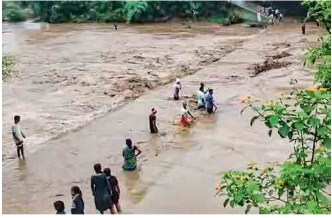
डिंडोरी (मध्य प्रदेश) : मुसळधार पावसामुळे येथील नदीच्या पुराचे पाणी सोमवारी पुलावरून वाहत होते. अशातही नागरिक जीव धोक्यात घालून रस्ता ओलांडत होते.

शाहजहांपूर : साखर मुलीवर तीन वर्षे लैंगिक अत्याचार केल्याच्या आरोपांनंतर चौकशीसाठी ताब्यात घेतलेल्या ३६ वर्षीय आरोपीचा पोलिस कोठडीत प्रकृती बिघडून मृत्यू झाला. शासक घेण्यास त्रास झाल्याने त्याला तातडीने रुग्णालयात दाखल करण्यात आले, मात्र उपचारदरम्यान त्याचा मृत्यू झाला.