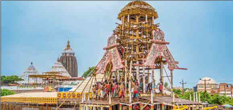
पुरी (ओडिशा) : रथांची अंतिम बांधणी आणि सजावटीचे काम कारागरी करीत आहेत.

भुवनेश्वर, ता. ६ : भगवान जगन्नाथांच्या रथयात्रेसाठी पुरीमध्ये लाखो भाविक येण्याची शक्यता आहे. ओडिशा सरकार आणि भारतीय रेल्वेने या सोहळ्याच्या तयारीला वेग दिला आहे. मुख्यमंत्री मोहन चरण माझी यांनी आज या उत्सवाच्या नियोजनाबाबत उच्चस्तरीय आढावा बैठक घेतली. भाविकांच्या सोयीसाठी ३०० हून अधिक विशेष गाड्या चालवण्याची घोषणा रेल्वेमंत्री अश्विनी वैष्णव यांनी केली आहे. पुरी येथे झालेल्या बैठकीत मुख्यमंत्र्यांनी तयारीचा आढावा घेतला. विविध सरकारी विभाग, जिल्हा प्रशासन, पोलिस, आरोग्य यंत्रणा, महापालिका आणि मंदिरातील सेवेकरी यांच्यातील समन्वयावर भर दिला. सुरक्षा, गर्दीचे नियोजन, आरोग्य सेवा, स्वच्छता, पिण्याचे पाणी, वाहतूक आणि वाहतूक नियंत्रण यावर २४ तास देखरेख