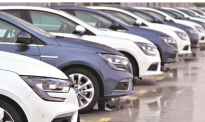
वित्त वर्ष 26 में वाहनों की 6 में से 5 श्रेणियों में रिकॉर्ड वार्षिक बिक्री दर्ज की गई और इससे वाहनों की कुल बिक्री 3 करोड़ के करीब पहुंच गई

यात्री वाहनों ने पहली बार 47 लाख का आंकड़ा पार किया और 13 प्रतिशत की बढ़ोतरी दर्ज की गई। दोपहिया वाहनों ने फिर से कोविड से पहले वाला शीर्ष स्तर हासिल कर लिया और 13.4 प्रतिशत वृद्धि के साथ 2.14 करोड़ से ज्यादा वाहनों की खुदरा बिक्री की। वाणिज्यिक वाहनों ने भी अब तक के सर्वश्रेष्ठ आंकड़े दर्ज किए और 11.74 प्रतिशत की बढ़त के साथ 10 लाख से ऊपर का स्तर छुआ। तिपहिया वाहनों ने 11.68 प्रतिशत के इजाफे के साथ लगातार तीसरे वर्ष वार्षिक रिकॉर्ड बनाया। ट्रैक्टर इस साल बेहतर प्रदर्शन करने वाली श्रेणी रही। इस श्रेणी ने 18.95 प्रतिशत की बढ़त के साथ इतिहास में पहली बार 10 लाख की खुदरा बिक्री का आंकड़ा पार किया। निर्माण उपकरण श्रेणी एकमात्र अपवाद रही, जिसमें 11.70 प्रतिशत की गिरावट दर्ज की गई। ऐसा इसलिए हुआ क्योंकि परियोजना-स्तर पर देरी और अधिक खर्च ने बिक्री को प्रभावित किया।