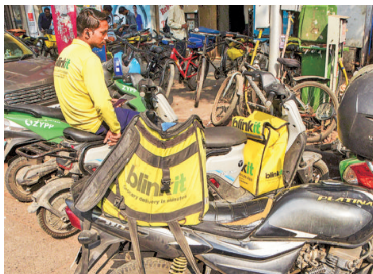
A gig worker stands outside a grocery store to pick up orders amid a strike call by unions on New Year's Eve, in Marine Lines, Mumbai