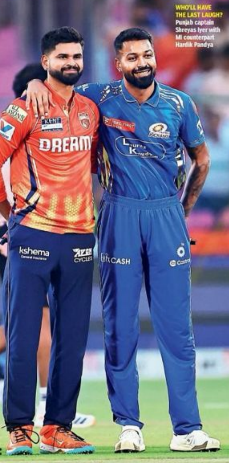
WHO'LL HAVE THE LAST LAUGH? Punjab captain Shreyas Iyer with MI counterpart Hardik Pandya

146 Sixes hit by PBKS in 15 matches, the second highest in this edition behind the 152 in 14 matches by LSG. MI, with 135 sixes, sit in fourth spot.