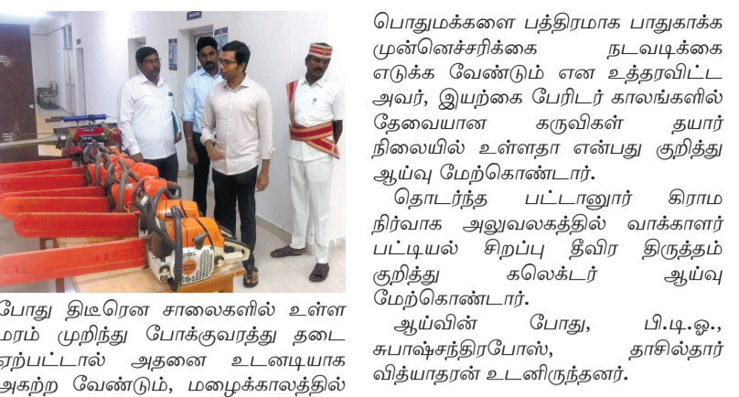
போது திடீரென சாலையில் உள்ள மரம் முறிந்து போக்குவரத்து தடை ஏற்பட்டால் அதனை உடனடியாக அகற்ற வேண்டும், மழைக்காலத்தில்