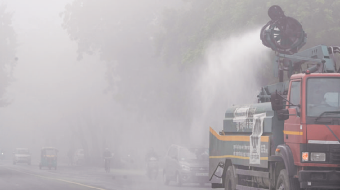
A municipal truck sprays water to suppress pollution amid dense foggy conditions in New Delhi on Monday