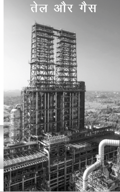
तेल और गैस

पिछले 60 वर्षों से भारत की ऊर्जा अवसंरचना का नेतृत्व