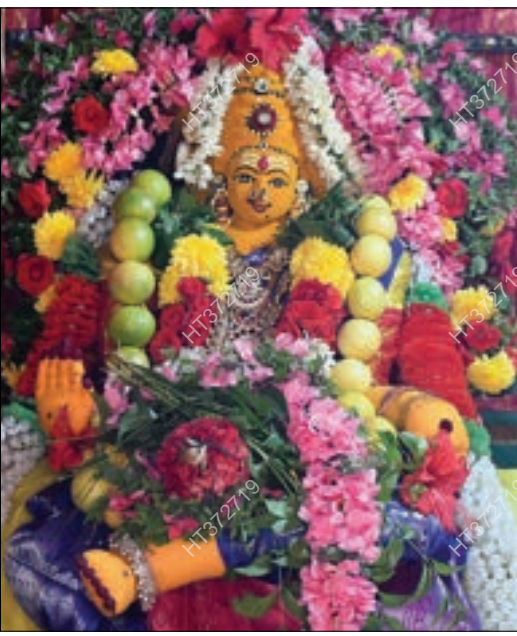
ஆடி முதல் வெள்ளியையொட்டி கோவை ராமநாதபுரம் பெரியார் நகரில் உள்ள ஸ்ரீ பண்ணாரி மாரியம்மன் கோயிலில் சிறப்பு அலங்காரத்தில் பக்தர்களுக்கு காட்சியளித்த பண்ணாரி மாரியம்மன். (அடுத்தபடம்) ஆயிரம் கண் அலங்காரத்தில் பக்தர்களுக்கு காட்சியளித்த பெரியகடைவீதி மாகாளியம்மன்.

ஆடி மாதத்தின் முதல் வெள்ளிக் கிழமையை முன்னிட்டு, கோவை, திருப்பூர், நீலகிரி மாவட்டங்களில் உள்ள அம்மன் கோயில்களில் நேற்று சிறப்பு பூஜைகள் நடைபெற்றன. கோவை பெரியகடைவீதியில் உள்ள கோனியம்மன் கோயில், உப்பிலிபாளையம் தண்டமாரியம்மன் கோயில், மேட்டுப்பாளையம் வன பத்ரகாளியம்மன் கோயில், கணபதி குலக்கல் மாரியம்மன் கோயில், பீளமேடு பெரியமாரியம்மன் கோயில், ஆவாரம்பாளையம் பண்ணாரி மாரியம்மன் கோயில், கணபதி மாநகர் பண்ணாரி மாரியம்மன் கோயில், பெரியார் நகர் ஸ்ரீ பண்ணாரி மாரியம்மன் கோயில், பெரியகடைவீதி மாகாளியம்மன் கோயில் உட்பட மாவட்டம் முழுவதும் பல்வேறு இடங்களில் உள்ள அம்மன் கோயில்களில் நேற்று அதிகமான நடை திறக்கப்பட்டு அம்மனுக்கு வெற்றிலை அலங்காரம், மலர் அலங்காரம், கஜாம்பிகை அலங்காரம் உள்ளிட்ட பல்வேறு அலங்காரங்கள் செய்யப்பட்டன. தொடர்ந்து அம்மனுக்கு பல்வேறு மந்திரங்கள் ஓத சிறப்பு பூஜைகள் நடத்தப்பட்டன. நேற்று அதிகாலை முதலே அம்மன் கோயில்களில் பக்தர்கள் திரண்டனர். நீண்ட வரிசையில் காத்திருந்து சுவாமி தரிசனம்