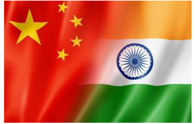
STRENGTHENING TIES. India and China are seeking to mend ties particularly strained since the 2020 border clashes

The government's top think tank NITI Aayog has proposed easing rules that de facto require extra scrutiny for investments by Chinese companies, arguing that the rules have meant delays for some sizeable deals, three government sources said.