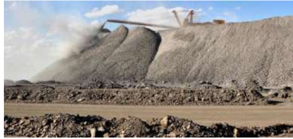
KEY SUPPLIER. India relies heavily on China for rare earth elements, with over 90% of its imports originating from the country

CRITICAL IMPORTS India relies heavily on China