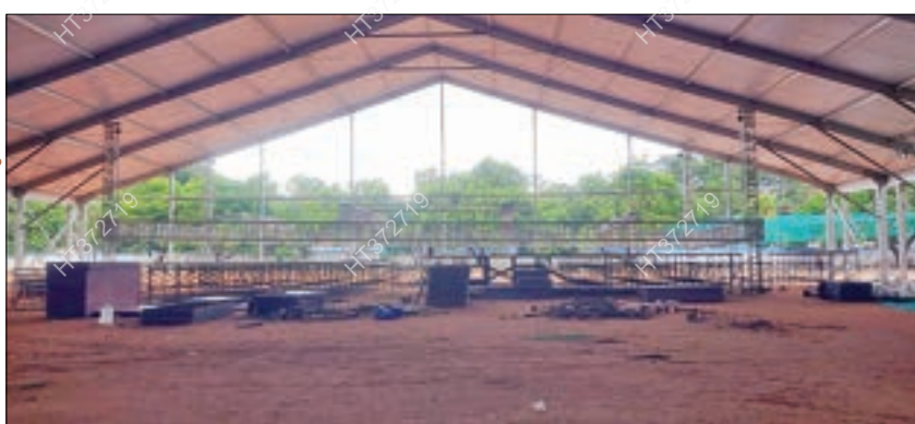
முதல்வர் பங்கேற்க உள்ள விழாவுக்காக உடுமலை நேதாஜி மைதானத்தில் அமைக்கப்பட்டு வரும் பிரம்மாண்ட பந்தல்.

உடுமலை திருப்பூர் மாவட்டத்தில் முடிவற்ற திட்டப் பணிகளை தொடங்கி வைக்கவும், புதிய திட்டங்களுக்கு அடிக்கல் நாட்டவும் வரும் 22-ம் தேதி தமிழக முதல்வர் மு.க.ஸ்டாலின் உடுமலைக்கு வர உள்ளார். அரசு ஆண்கள் மேல்நிலைப் பள்ளிக்கு சொந்தமான நேதாஜி மைதானத்தில் விழாவுக்கான முன்னேற்பாடு பணிகள் தீவிரமாக நடைபெற்று வருகின்றன. முதல்வர் வருகையை முன்னிட்டு, உடுமலை நகரின் முக்கிய சாலைகளில் பராமரிப்புப் பணிகள் முடிக்கி விடப்பட்டுள்ளன. விழாநடைபெற உள்ள மைதானத்தைச் சுற்றிலும் இருந்த சாலையோரக் கடைகள் அகற்றப்பட்டுள்ளன. மைதானத்தில் உட்பகுதியில் பிரம்மாண்டமான பந்தல் அமைக்கும்பணிகள் கடந்த 4 நாட்களாக நடைபெற்று வருகின்றன. இவ்விழா முடியும் வரை, மைதானத்தில் நடை