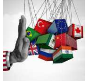
India must tell the US that all trade talks should be handled only by official negotiators, says the GTRI report

A bad bilateral trade deal with the US — which forces India to bring down its tariffs without reciprocal benefits — could be worse than no deal at all and the country must guard against it, trade research body GTRI has suggested.