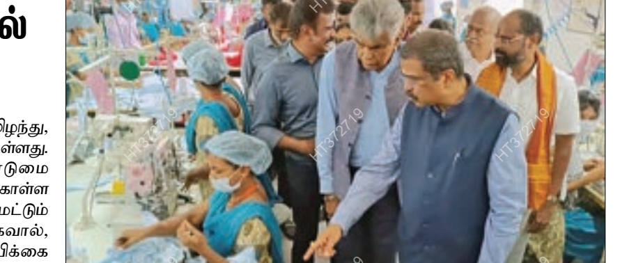
திருப்பூர் நேதாஜி ஆயத்த ஆடை பூங்காவில் அமைந்துள்ள பின்னலாடை நிறுவனத்தில் நேற்று ஆய்வு செய்த மத்திய அமைச்சர் தர்மேந்திர பிரதான் உள்ளிட்டோர்.