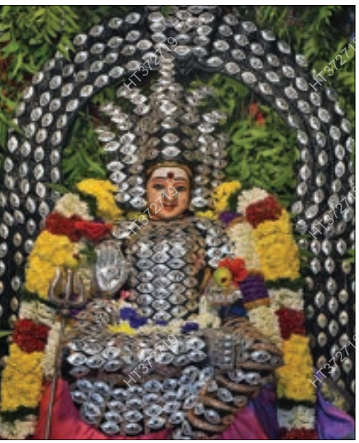
ஆடி முதல் வெள்ளியையொட்டி கோவை ராமநாதபுரம் பெரியார் நகரில் உள்ள ஸ்ரீ பண்ணாரி மாரியம்மன் கோயிலில் சிறப்பு அலங்காரத்தில் பக்தர்களுக்கு காட்சியளித்த பண்ணாரி மாரியம்மன். (அடுத்தபடம்) ஆயிரம் கண் அலங்காரத்தில் பக்தர்களுக்கு காட்சியளித்த பெரியகடைவீதி மாகாளியம்மன்.