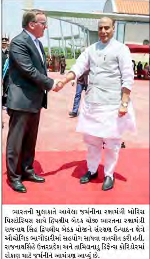
ભારતની મુલાકાતે આવેલા જર્મનીના રક્ષામંત્રી બોરિસ પિસ્ટોરિયસ સાથે દ્વિપક્ષીય બેઠક યોજી ભારતના રક્ષામંત્રી રાજનાથ સિંહ દ્વિપક્ષીય બેઠક યોજીને સંરક્ષણ ઉત્પાદન ક્ષેત્રે ઔદ્યોગિક ભાગીદારીમાં સહયોગ સાધવા વાતચીત કરી હતી. રાજનાથસિંહે ઉત્તરપ્રદેશ અને તામિલનાડુ ડિકેન્સ કોરિડોરમાં રોકાણ માટે જર્મનીને આમંત્રણ આપ્યું છે.

ગ્રાહક સુવિધામાં ખામી ધરાવતી બ્રાંચોને સર્વિસ સુધારવા માટે ઈન્સ્ટીટ્યુટ ડીસ ટ્રાન્સફર ડ્રોમ્યુંલા દાખલ કરવા ગ્રાહકની ફરીયાદ સીધી આરબીઆઈ ટ્રેક કરી શકે તેવી સિસ્ટમ કોઈવવા પણ સૂચવ્યું છે. અત્યારની સીસ્ટમ પ્રમાણે ગ્રાહક ફરીયાદ પોર્ટલમાં નાખે ત્યાં સુધી રીઝર્વ બેન્ક વાકેફ થતી નથી. આ ઉપરાંત ખાતા ધારકનું અવસાન થવાના સંબંધોમાં તેના વારસદારના દાવાનું ઓનલાઈન નિરાકરણ લાવવા નિયમીત સમયોત્તરે કેવાયસી અપડેટ કરાવવા ભલામણ કરી છે. બેંક આ પ્રક્રિયામાં ગ્રાહકોના ખાતા બંધ ન થઈ જાય કે કોઈ અન્ય મુદ્દેલી ન પડે તે જોવા પણ તાકીદ કરી છે. પેન્શનરને બેંકની કોઈપણ બ્રાંચમાં સર્ટીફિકેટ રજુ કરવાની સુવિધા આપવાની પણ ભલામણ કરવામાં આવી છે.