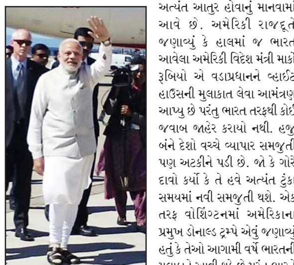
એ દાવો કર્યો છે કે વડાપ્રધાન મોદી ડિસેમ્બર માસમાં અમેરિકામાં યોજનાર જ-૨૦ દેશોની શિખર પરિષદમાં હાજરી આપશે. જો કે