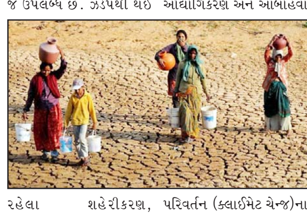
જ ઉપલબ્ધ છે. ઝડપથી થઈ ઔદ્યોગિકરણ અને આબોહવા દબાણને કારણે વર્તમાન સંસાધનો પર બોજ વધી રહ્યો છે. નિષ્ણાતોનું કહેવું છે કે, પાણીની માંગ અને પુરવઠા વચ્ચેનો તફાવત વધી રહ્યો છે, જેના માટે આગામી દાયકામાં મોટા પાયે રોકાણની જરૂર પડશે. પીએલ કેપિટલના એક અહેવાલ મુજબ, ૨૦૩૦ સુધીમાં ભારતમાં પાણીની માંગ ઉપલબ્ધ પુરવઠા કરતાં બમણી થઈ શકે છે. આનાથી આગામી ૧૦ વર્ષોમાં

વોટર ટ્રીટમેન્ટ, વેસ્ટવોટર રિસાયકલિંગ, સીવેજ ઈન્ફ્રાસ્ટ્રક્ચર, રિસ્ટ્રિબ્યુશન નેટવર્ક અને સ્ટોરેજ સિસ્ટમમાં લગભગ રૂ. ૨૦ લાખ કરોડના રોકાણની તક ઊભી થઈ શકે છે. આર્થિક ઉત્તાર-ચઢાવ સાથે બદલાતા અન્ય ઈન્ફ્રાસ્ટ્રક્ચર સેક્ટરથી વિપરીત, પાણીની સુરક્ષામાં રોકાણ મુખ્યત્વે માળખાકીય (સ્ટ્રક્ચરલ) કારણોસર વધી રહ્યું છે.