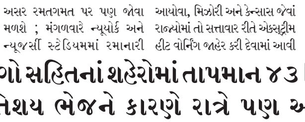
અસર રમતગમત પર પણ જોવા મળશે ; મંગળવારે ન્યૂયોર્ક અને ન્યૂજર્સી સ્ટેડિયમમાં રમાનારી આયોવા, મિઝોરી અને કેન્સાસ જેવાં રાજ્યોમાં તો સત્તાવાર રીતે એક્સટ્રીમ હીટ વોર્નિંગ જાહેર કરી દેવામાં આવી

એ અપીલ કરી છે. જેથી તંત્રે પબ્લિકને બપોરે બહાર ન નીકળવા અને સતત હાઈડ્રેટેડ રહેવા અપીલ કરી છે.