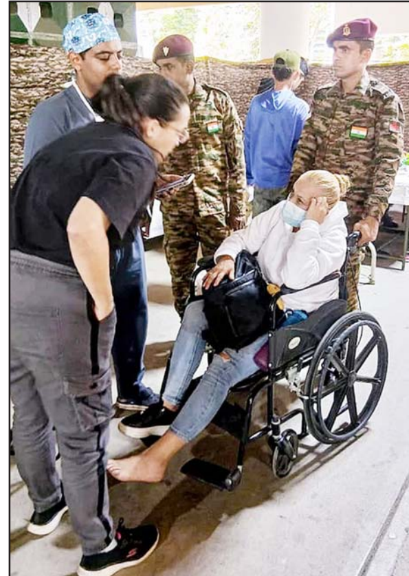
દક્ષિણ અમેરિકાના દેશ વેનેઝુએલામાં આવેલા વિનાસકારી ભૂકંપ બાદ બચાવ રાહત માટે પહોંચેલી ભારતીય ટીમના સભ્યો ભૂકંપ પીડીતોને માનવીય ધોરણે રાહત સામગ્રી અને તબીબી સહાય ઉપલબ્ધ કરાવી રહ્યા છે.