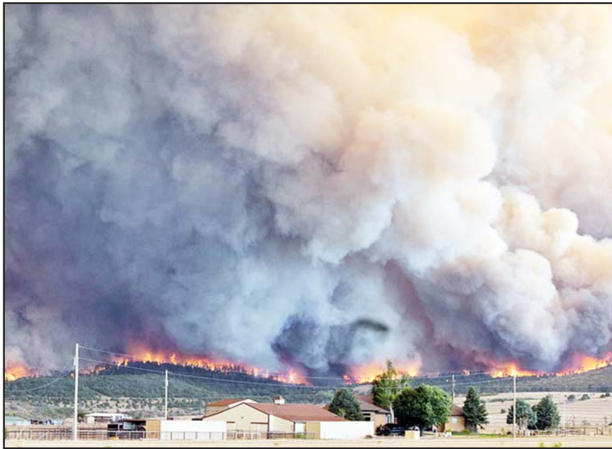
અમેરિકાના કોલોરાડોમાં પ્યુબ્લો કાઉન્ટીમાં આસ્પેન એકસમાં લાગેલી આગે ભીષણ સ્વરૂપ લઈ રહ્યાં છે. આસપાસના વસાહત વિસ્તારો ખાલી કરાવવામાં આવી રહી છે. પર્વતીય વિસ્તારમાંથી આગની જવાબાઓ સાથે ધુમાડો નીકળી રહ્યો છે.

અત્યારે વધીને ૬૬ ટકાને પાર કરી ગયો છે. ખાસ કરીને પેરિસમાં સ્થિતિ વધુ વિકટ છે, જ્યાં ઘણા ફ્યુનરલ હોમ્સ સંપૂર્ણપણે ભરાઈ ગયા છે. હવે લોકોએ તેમના સ્વજનોના અંતિમ સંસ્કાર માટે પેરિસ શહેરની બહાર અથવા દૂરના વિસ્તારોમાં જવું પડી રહ્યું છે. કબ્રસ્તાનમાં દફનવિધિ માટે પણ જગ્યાનો અભાવ સર્જાયો છે. કબ્રસ્તાનના કામદારો મૃતકોની વધતી સંખ્યા સામે ઝડપથી કબરો ખોદવામાં અસમર્થ સાબિત થઈ રહ્યા છે. નિષ્ણાતો હવે 'ડોમિનો ઈફેક્ટ'ની ચેતવણી આપી રહ્યા છે, જ્યાં એક ઘટનાની સાંકળ બીજી ગંભીર સમસ્યાઓને નોતરતી રહી છે. ફાન્સના વડા પ્રધાન સેબેસ્ટિયન લેકોર્નુએ આ ગંભીર કટોકટીને પહોંચી વળવા માટે તાત્કાલિક ઉચ્ચ સ્તરીય બેઠક યોજી છે.