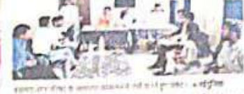
23 में से 21 प्रस्ताव पारित

23 में से 21 प्रस्ताव पारित। 23 में से 21 प्रस्ताव पारित।