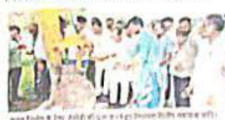
आम निर्माण के लिए नौगावा की सड़क का भूमिपूजन किया गया (संवादक)

रौयाल विधायक दितीय मकचाना के आतिथ्य में हुआ नामती-नौगावा कलां मार्ग निर्माण का भूमिपूजन