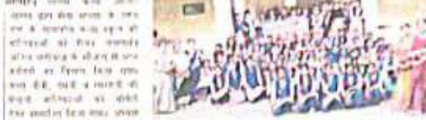
कन्या स्कूल की बालिकाओं को कापियां दीं

कन्या स्कूल की बालिकाओं को कापियां दीं। स्कूल की बालिकाओं को कापियां दीं।