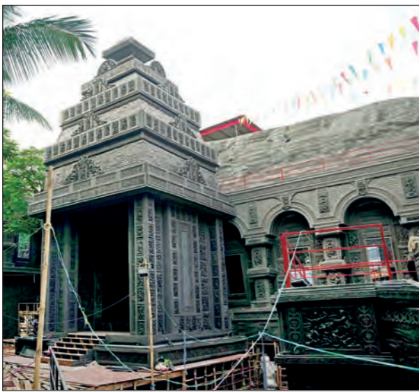
ত্রিধারার মণ্ডপ তৈরির কাজ চলছে।

কংক্রিটের শহুরে জীবনে বহুতল, বাঁচকচক রেস্তোরাঁ, কালো পিচের রাস্তা দেখতে দেখতে একঘেরিয়ে লাগবেই। তখন মনে হতে পারে উৎসব মরগুমে একটু স্থান পরিবর্তনের। শহরের কোণে এক গম্বুজের দিকে এগোতেই হঠাৎ দেখা মিলল দারুণ এক মনোমুগ্ধকর জায়গা। যা দেখে আলাদা একটা অনুভূতি তৈরি হলেই। পথ চলাতে চলতে দক্ষিণ কলকাতার মনোহরপুকুর রোডে হঠাৎ দেখতে পাওয়া যাবে প্রকৃতির সান্নিধ্য থাকা শিল্প দর্শন। দেখা যাবে খোলা নীল আকাশের নীচে ধূসর পাহাড় আর সেই পাহাড়ের অংশ কেটে তৈরি হয়েছে মন্দির। রয়েছে প্রাচীন শিল্পকলা। ত্রিধারা অকালবোধনের ৭৯তম বর্ষের জন্য 'চলো ফিরি'র মাধ্যমে দেখা যাবে কীমো জয়গায় নাট্য পর্যটনের স্বাদ। পাশাপাশি ভারতীয় পূজা অর্চনা, আধ্যাত্মিকবাধে এবং সংস্কৃতির ছবি।