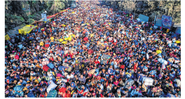
MASS GATHERING: Hindu devotees arrive for a holy dip at Sangamon the eve of the Mauni Amavasya or new moon day during Maha Kumbh festival on Tuesday