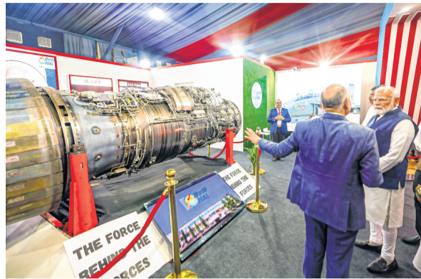
Prime Minister Modi at an exhibition during the Utkarsh Odisha Conclave in Bhubaneswar on Tuesday

"Odisha is outstanding and it is the symbol of optimism and