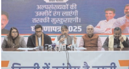
दिल्ली में कांग्रेस सरकार बनाने पर एससी/एसटी/ओबीसी/अल्पसंख्यक व विकलांग वित्तीय एवं विकास निगम को मजबूत करेंगे : इमरान मसूद, सांसद

नई दिल्ली, 30 जनवरी (देशबन्धु)। उत्तर प्रदेश के सहारनपुर से सांसद इमरान मसूद ने घोषणा पत्र में अल्पसंख्यकों हेतु योजनाओं के संदर्भ में विस्तारपूर्वक चर्चा करने के लिए दिल्ली प्रदेश के लिए कटिबद्ध हैं। हमारे नेता जन नायक श्री राहुल गांधी अल्पसंख्यकों के अधिकारों, हितों और सुरक्षा के लिए पूरे देश में सड़क से संसद तक लड़ाई लड़ रहे हैं। इमरान मसूद ने कहा कि दिल्ली में कांग्रेस सरकार बनाने पर कांग्रेस कांग्रेस एससी/एसटी/ओबीसी/अल्पसंख्यक और विकलांग वित्तीय एवं विकास निगम को मजबूत करेंगे, ताकि