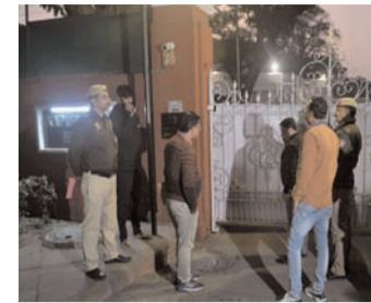
जूते, चादर बांट रहे हैं, मगर पुलिस और चुनाव आयोग की आंखों पर तो भाजपाई पट्टी बंधी है। पुलिस और चुनाव आयोग में हिम्मत है तो गृह मंत्री अमित शाह के घर पर रेड करे।

नई दिल्ली, 30 जनवरी (देशबन्धु)। दिल्ली की मुख्यमंत्री आतिशी ने दावा किया कि दिल्ली पुलिस पंजाब के मुख्यमंत्री भगवंत मान के दिल्ली स्थित घर पर छापे मारने पहुंची है। सुप्री आतिशी ने आज एक्स पर कहा दिल्ली पुलिस भगवंत मान के दिल्ली के घर पर रेड करने पहुंच गई है। भाजपा वाले दिन दहाड़े पैसे, जूते, चदर बांट रहे हैं- वो नहीं दिखता। बल्कि एक चुने हुए मुख्यमंत्री के निवास पर रेड करने पहुंचे जाते हैं। वाहरी भाजपा! दिल्ली वाले पांच तारीख को जवाब देंगे। आम आदमी पार्टी ने कहा हार सामने देख, कांप उठी भाजपा। भाजपा वाले दिन दहाड़े पैसे,