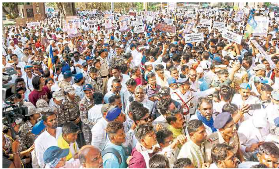
नागपूर : वंचित बहुजन आघाडी आणि कॉॅंग्रेसने केंद्र सरकारच्या निषेधाथी राष्ट्रीय स्वयंसेवक संघ मुख्यालयावर सोमवारी जनआक्रोश मोर्चा काढला. त्यात मोठ्या प्रमाणावर कार्यकर्ते सहभागी झाले होते.