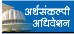
सकाळ न्यूज नेटवर्क