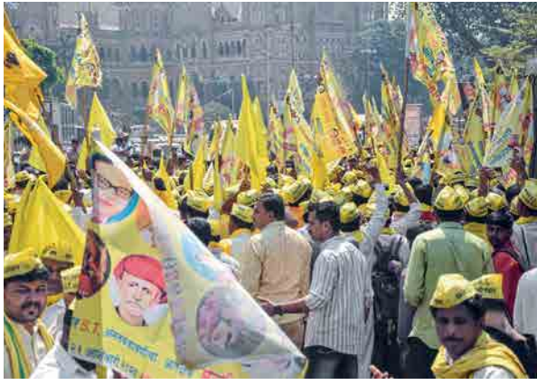
मुंबई : अनुसूचित जमाती प्रवाग संमेलनाच्या मागणीसाठी धनगर समाजातील नागरिकांनी सोमवारी छत्रपती शिवाजी महाराज टर्मिनसजवळील आझाद मैदान येथे आंदोलन केले.