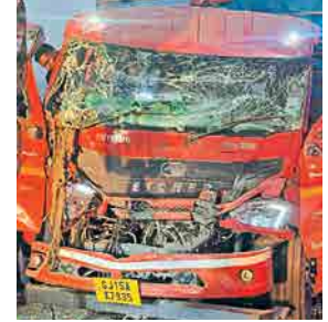
खालापूर : अपघातग्रस्त वाहन.

खालापूर तालुक्यातील तीन वेगवेगळ्या ठिकाणी झालेल्या अपघातांत एक जण ठार तर दोन जण जखमी झाले. पहिला अपघात रसायनी पोलिस ठाण्याच्या हद्दीत रिविवारी रात्री झाला. भरधाव टँकरने रस्त्याच्या कडेला बंद पडलेल्या आयशर टेम्पोला जोरदार धडक दिली. दुसरा अपघात खोपोली पोलिस ठाण्याच्या हद्दीत मुंबई-पुणे द्रुतगती मार्गावर सोमवारी पहाटे घडला. तिसरा अपघात जुन्न्या मुंबई-पुणे राष्ट्रीय महामार्गावर सोमवारी दुपारी सुमारे ३ वाजता घडला.