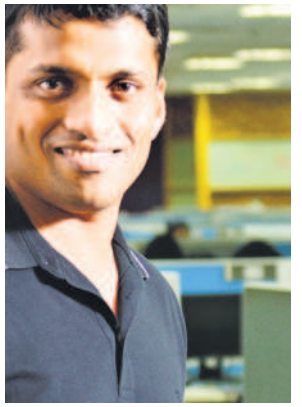
Byju Raveendran said the ruling was "procedural".

The contempt proceedings add to broader legal battles surrounding Byju's, including ongoing litigation in the United States where lenders are seeking to recover losses tied to a $1.2 billion term loan. In a statement issued after