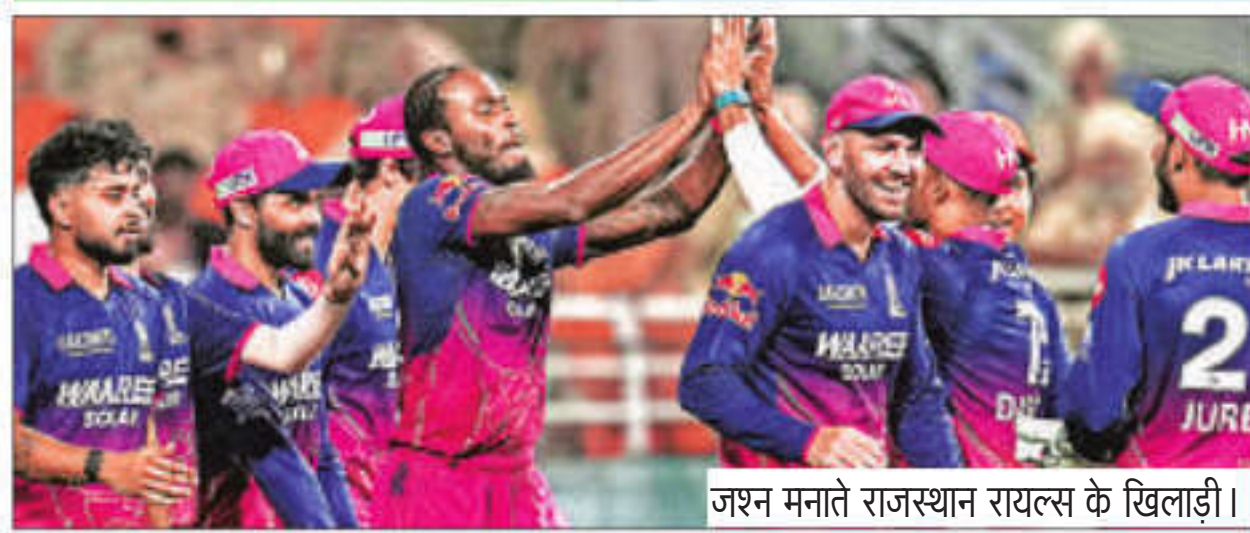
जश्न मनाते राजस्थान रायल्स के खिलाड़ी।