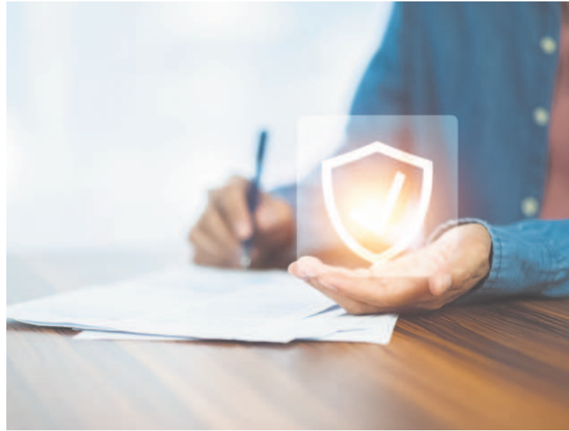
Revised insurance rules now require only one of three key management positions to be held by an Indian resident, easing earlier governance restrictions.

Under revised rules, at least one among three key positions in an insurance company needs to be held by an Indian resident, compared with earlier when insurers were required to maintain a majority of resident Indian citizens among its directors and Key Management Persons, including at least one among the chairperson, managing director and chief