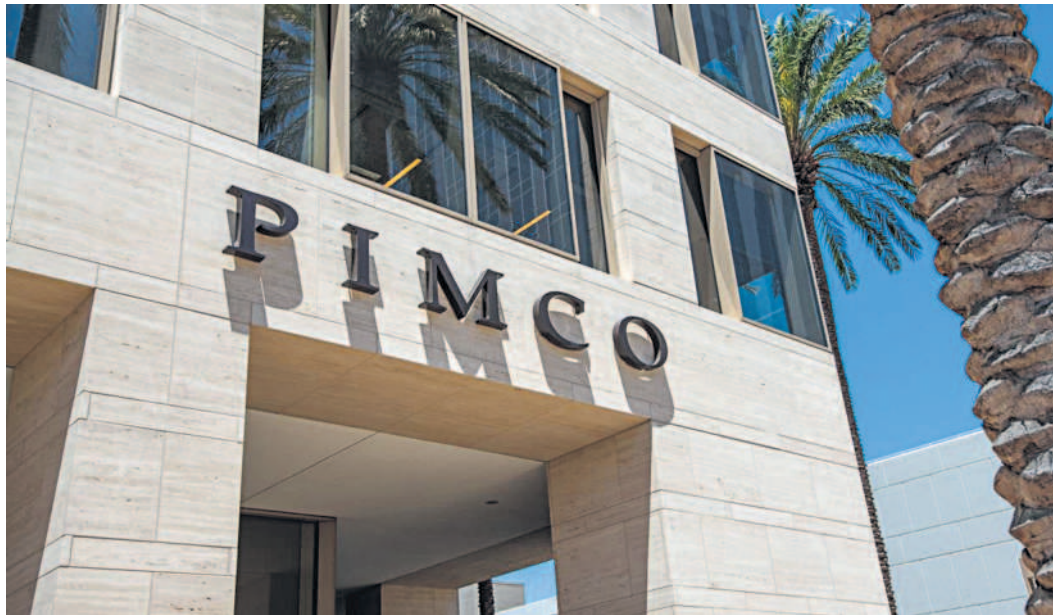
The intense jockeying that went on behind the scenes underscores the huge financial stakes behind the rise of AI and the rapid build-out of the computing and power infrastructure needed to feed chatbots.

For borrowers, private credit costs more, but is attractive because it allows them to keep a tighter leash on the process without broadly releasing information about their data centres. For lenders, it offers a