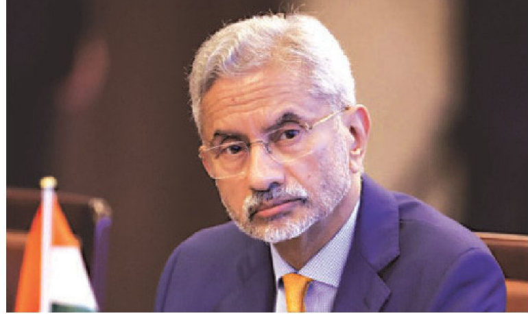
एस जयशंकर, विदेश मंत्री

वांग यी की यात्रा और जयशंकर-लावरोव बैठक से एससीओ में प्रधानमंत्री मोदी, शी चिनफिंग और पुतिन की बातचीत के लिए होगा माहौल तैयार