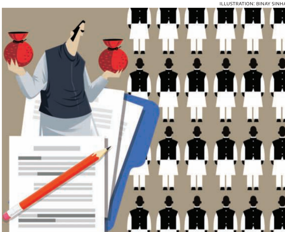
ILLUSTRATION: BINAY SINHA

Third, this reform architecture delivered results only temporarily, as the combined revenue account of the states moved into surplus during 2007-08, 2008-09 and again during 2011-13, which in turn reduced the scope of RDGs under the 13th FC to only eight special-category states. However, these gains proved fragile when revenue deficits reappeared again during 14th FC tenure and hence a decision was made to award substantial RDGs, raising them from 1.1 per cent of gross tax