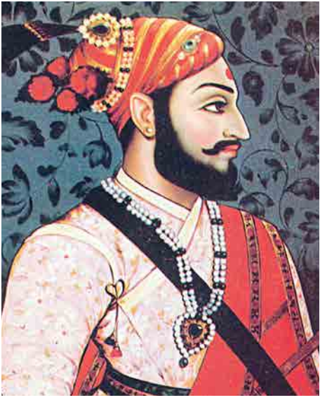
छत्रपती संभाजी महाराज

छत्रपती संभाजीराजे जसे तलवारबाजीमध्ये निपुण होते, तसेच ते साहित्य क्षेत्रातही प्रजावंत होते. त्यांचे संस्कृतवर प्रभुत्व होते. त्यांनी संस्कृत भाषेत 'बुधभूषण' नावाचा ग्रंथ लिहिलेला आहे. हिंदी भाषेतही ते निष्णात होते. हिंदी भाषेत त्यांनी नखशिख, नायिकाभेद आणि सातसप्तक हे ग्रंथ लिहिले. त्यांनी इंग्रजी भाषेची उत्तम जाण होती. मराठी भाषेचे ते तारणहार होते. सतराव्या शतकात अनेक भाषांवर प्रभुत्व असणारे छत्रपती संभाजीराजे भाषाप्रभू होते, तसेच ते बहुश्रुत होते. वेद, पुराण, सहा शास्त्रे आणि महाकाव्यांचे