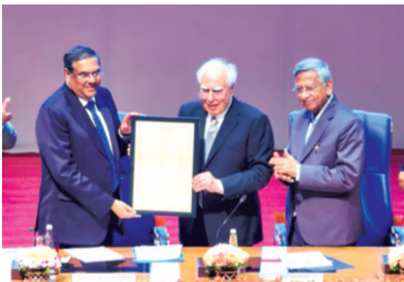
Outgoing CJI Sanjiv Khanna (left) during a farewell function organised by the Supreme Court Bar Association

Chief Justice of India Sanjiv Khanna on Tuesday said though he wasn't going to accept any post-retirement official assignments, he would continue his innings in law.