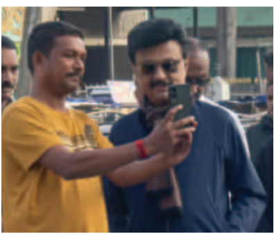
வழிநெடுகிலும் சாலையோரம் திரண்ட தி.மு.க.வினர், பொதுமக்கள் முதல்வரை உற்சாகத்துடன் வரவேற்றனர். பாம்பார்புளம் பகுதியில் உள்ள தனியார் விடுதியில் முதலமைச்சர் குடும்பத்துடன் தங்கி ஓய்வெடுத்து வருகிறார். 2.9ம் தேதி வரை இங்கு தங்கும் முதல்வர் 30ம் தேதி சென்னை திரும்ப உள்ளார்.

கொடைக்கானல், ஏப். 26- கொடைக்கானலில் முதலமைச்சர் ஸ்டாலின் நடைபயிற்சி போது, அங்கிருந்தவர்கள் அவருடன் செல்பி எடுத்து மகிழ்ந்தனர். தமிழகசட்டசபை தேர்தலையொட்டி முதலமைச்சர் மு.க.ஸ்டாலின் கடந்த ஒரு மாதத்துக்கும் மேலாக பல்வேறு மாவட்டங்களுக்கும் தொடர்ச்சியாக சுற்றுப்பயணம் மேற்கொண்டு, தீவிர பிரச்சாரம் மேற்கொண்டார். தற்போது வாக்குப்பதிவு முடிவடைந்த நிலையில் சென்னையில் இருந்து முதல்வர் ஸ்டாலின், தனது மனைவி, மகன், பேரன், பேத்தி உள்ளிட்ட குடும்பத்தினருடன் நேற்று காலை தனி விமானத்தில் புறப்பட்டு மதுரைக்கு சென்று அங்கிருந்து காரில் பிற்பகல் 2.45 மணிக்கு கொடைக்கானல் வந்தடைந்தார்.