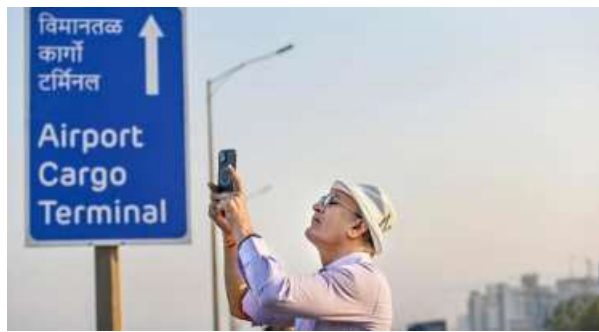
Urban facelift: The airport's phase-wise progress is reshaping the region's urban landscape.

The impact is already visible in the real estate sector, with developers accelerating project deliver-