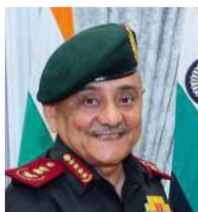
Gen. Anil Chauhan

"The concept of establishing theatre commands is to create two parallel and complementary streams for 'Force Application' and 'Force Generation'. The Force Application component will become the responsibility of a theatre commander, whereas service chiefs, in