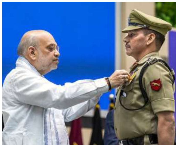
Union Home Minister Amit Shah confers a medal on Second Command Officer Anil Kumar at the BSF investiture ceremony.

The Union Home Minister added that Pakistan proved that it sponsors terrorism by considering the