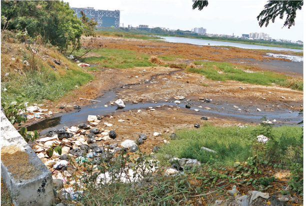
பள்ளிக்கரணை சதுப்பு நிலத்தில் கழிவுநீர் கலந்து குப்பை கொட்டப்பட்டு பராமதிக்கப்படாமல் கிடக்கிறது. இதனால் மாசு அடைந்து அப்பகுதி முழுவதும் தூர்நாறும் வீசுகிறது.

இந்த மலர் அலங்காரங்களுக்கான கொய்யம் மலர்கள் உள்ளூர் வியாபாரிகளிடம் இருந்தும், கூடுதல் மலர்கள் வெளி மாநிலத்தில் இருந்தும் வாங்கி பயன்படுத்தப்பட்டுள்ளது.