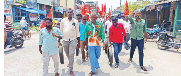
நூதன போராட்டத்தில் ஈடுபட்ட மார்க்சிஸ்ட் கட்சியினர்.

வந்தவாசி, மே 18- பெட்ரோல், டீசல் விலை உயர்வை கண்டித்து நடவடிக்கை மேற்கொள்ள வேண்டும் என வாழ்ப்பாடி போலீசில் மாவட்ட முதன்மை கல்வி அலுவலர் புகார் அளித்தார். அப்புகாரின் பேரில், போலீசார் வழக்குப்பதிவு செய்து விசாரணை மேற்கொண்டனர்.