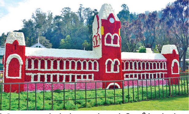
ஊட்டி மலர்க்கண்காட்சியில் ஒரு லட்சம் மலர்களை கொண்டு வடிவமைக்கப்பட்ட மாமல்லபுரம் கோயிலும் மற்றும் 1.5 லட்சம் கார்னேசன் மலர்களைக் கொண்டு அமைக்கப்பட்டுள்ள சென்னை சென்ட்ரல் ரயில் நிலையம் பார்வையாளர்களை வெகுவாக கவர்ந்துள்ளது.