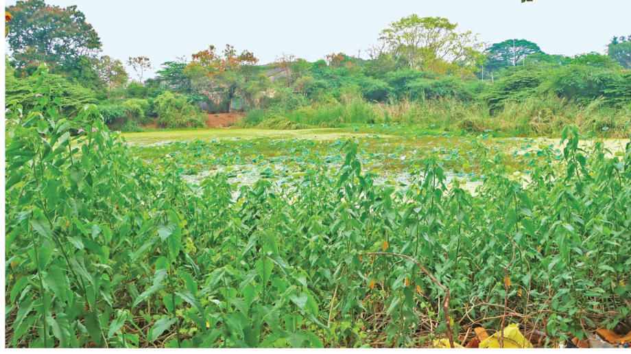
பூந்தமல்லி அடுத்த திருமழிசை சிப்காட் எதிரே உள்ள குளம் முழுவதும் செடி கொடிகள் மற்றும் சீமை கருவேல மரங்கள் காடு போல் வளர்ந்துள்ளன.

வாய்ப்பையும் பெறலாம் என்று தேவஸ்தானம் தெரிவித்துள்ளது. 18 மணிநேரம் காத்திருப்பு திருப்பதி ஏழுமலையான் கோயிலில் நேற்று 91,020 பக்தர்கள் சவாமி தரிசனம் செய்தனர். 35,193 பக்தர்கள் தலை முடி காணிக்கை செலுத்தினர். கோயில் உண்டியலில் ரூ.3.54 கோடி காணிக்கை கிடைத்துள்ளது. இன்று காலை வைகுண்டம் கியூ காம்பளில் உள்ள 31 அறைகளில் பக்தர்கள் தங்கியுள்ளனர். இவர்கள் சுமார் 18 மணி நேரம் காத்திருந்து சவாமிமய தரிசனம் செய்கின்றனர். ரூ.300 டிக்கெட் பெற்ற பக்தர்கள் 3 மணி நேரத்திலும், நேர ஒதுக்கீடு டிக்கெட் பெற்ற பக்தர்கள் 6 மணி நேரத்திலும் தரிசனம் செய்தனர்.