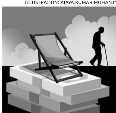
ILLUSTRATION: AJAYA KUMAR MOHANTY

The Pension Fund Regulatory and Development Authority (PFRDA) has launched the Retirement Income Scheme (RIS), an asset allocation plan for investors who choose to retain the withdrawable portion of their retirement corpus with the National Pension System (NPS). Two drawdown options have been made available: Systematic payout rate (SPR) and systematic unit redemption (SUR). Surrender norms for annuities have also been eased.