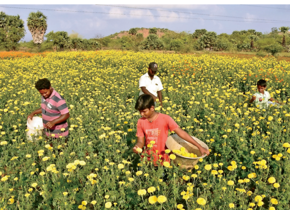
திருப்போரூர் ஒன்றியம் திருநிலை பகுதியில் சாமந்தி பூக்கள் விளைச்சல் அதிகரித்துள்ளது. அவற்றை விற்பனைக்காக பறிக்கும் பணியில் ஈடுபட்டுள்ள தொழிலாளர்கள்.

கலைஞர் எழுதுகோல் விருதிற்கான தகுதிகள் பின்வருமாறு: விண்ணப்பதாரர் தமிழ்நாட்டை சேர்ந்தவராகவும், தமிழ் இதழியல் துறையில் குறைந்தபட்சம் 10 ஆண்டுகளாக தொடர்ந்து பணிபுரிகின்