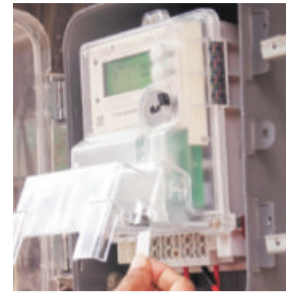
In February, Madhyanchal power discom had cancelled the Adani group's bid for 7.5 million smart meters

Meanwhile, Purvanchal has floated fresh tenders after dividing the districts under its