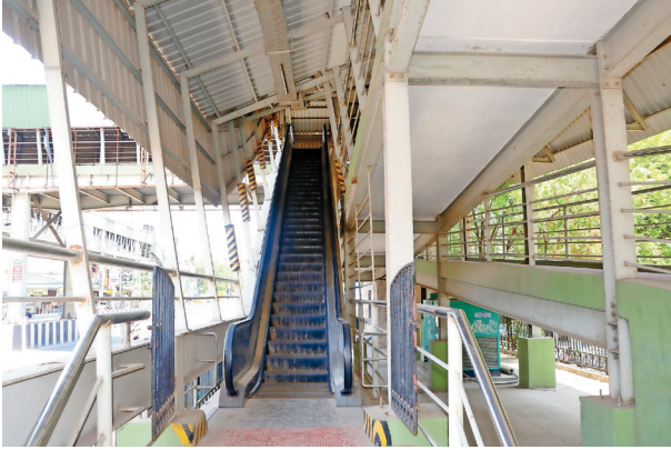
சென்னை தரமணி நெடுஞ்சாலை, ஸ்ரீராம் நகர் அருகே சாலையை கடக்க எஸ்கலேட்டருடன் கூடிய நடைமேம்பாலம் அமைக்கப்பட்டுள்ளது. இந்த எஸ்கலேட்டர் பல நாட்களாக இயங்கவில்லை. இதனால் பொதுமக்கள் மிகவும் சிரமப்பட்டு கின்றனர். விரைவில் சீரமைக்க கோரிக்கை விடுத்துள்ளனர்.