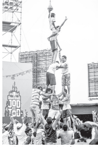
मुंबई, दि. ३० (प्रतिनिधी) : दहीहंडी उत्सव अवघ्या चारच दिवसांवर येऊन ठेपला