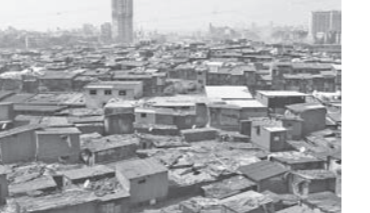
न्यायालयाचे म्हणणे काय ?

मुंबई, दि. ३ : विशेष प्रतिनिधी राज्य सरकारचा महत्वाकांक्षी प्रकल्प असलेल्या धारावी पुनर्विकास प्रकल्पामध्ये (डीआरपी) धारावी कोळीवाड्याचा समावेश करवा की नाही, या वादावर लवकरच पडदा पडण्याची शक्यता आहे. या प्रकरणात ठोस कागदोपत्री पुराव्यांची कमतरता असल्याने, प्रकल्पाची सध्याची भौगोलिक सीमारेषा बदलता येणार नसल्याची माहिती विविक्षनीय सूत्रांकडून देण्यात आली आहे. या प्रकरणाशी संबंधित असलेल्या सूत्रांकडून प्राप्त झालेल्या माहितीनुसार, धारावी पुनर्विकास प्रकल्पातून कोळीवाड्याला वगळण्यासाठी करण्यात आलेल्या निवेदनांची आणि याबाबत नोंदविण्यात आलेल्या आक्षेपांची दखल संबंधित यंत्रणांकडून घेण्यात आली. मात्र, याबाबत पडताळणी करताना धारावी पुनर्विकास प्रकल्पाची निविदा आणि सरकारच्या अधिसूचनेत नमूद करण्यात आलेली प्रकल्पाची सध्याची भौगोलिक सीमारेषा अवैध ठरविण्याबाबत सबळ कागदोपत्री पुरावा उपलब्ध झाला नाही. धारावी कोळीवाड्याच्या हद्दीचा वाद