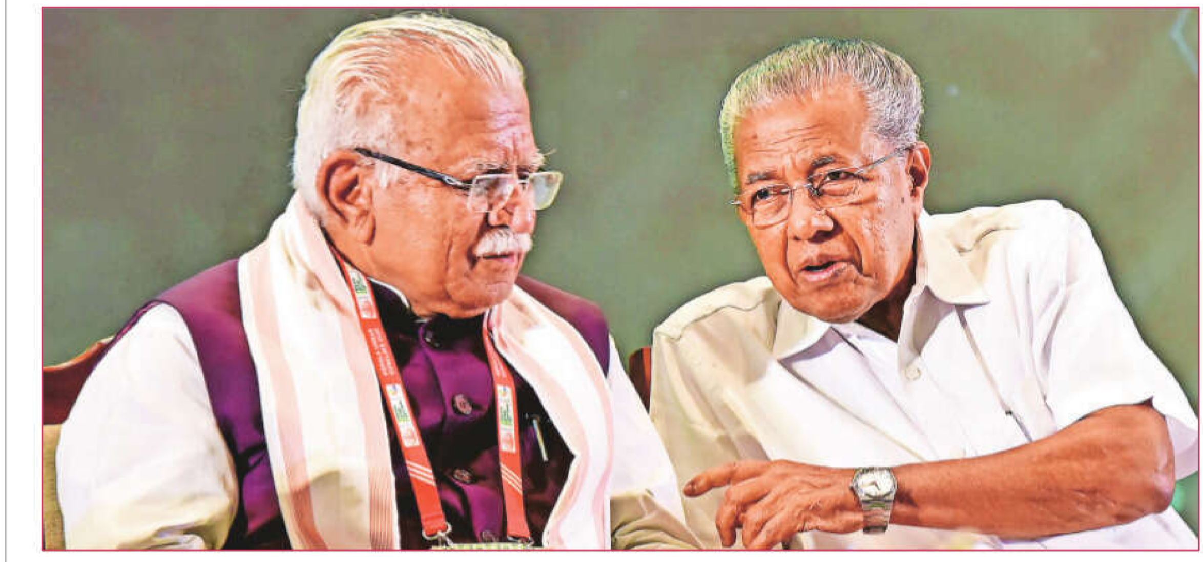
Union minister of housing and urban affairs Manohar Lal and Kerala Chief Minister Pinarayi Vijayan during the inauguration of the two-day Kerala Urban Conclave 2025, in Kochi, on Friday. Vijayan said Kerala, which has a higher urban growth rate than the national average, is preparing to address the challenges of urbanisation