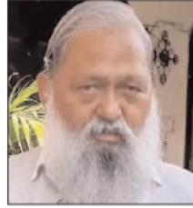
एक्स पर मांगी लोगों से सलाह। समर्थकों ने की कई तरह की टिप्पणियां।

यह पोस्ट आते ही सोशल मीडिया पर चर्चा का बड़ा मुद्दा बन गया। विज ने लोगों से राय मांगी तो टिप्पणी बाक्स में प्रतिक्रियाओं की झड़ी लग गई। किसी ने लिखा- 'अनिल विज को रामबिलास शर्मा बनाएगी बीजेपी', तो किसी ने उन्हें सीधे मुख्यमंत्री से बात करने की सलाह दी। यह पहली बार नहीं है जब अनिल विज ने