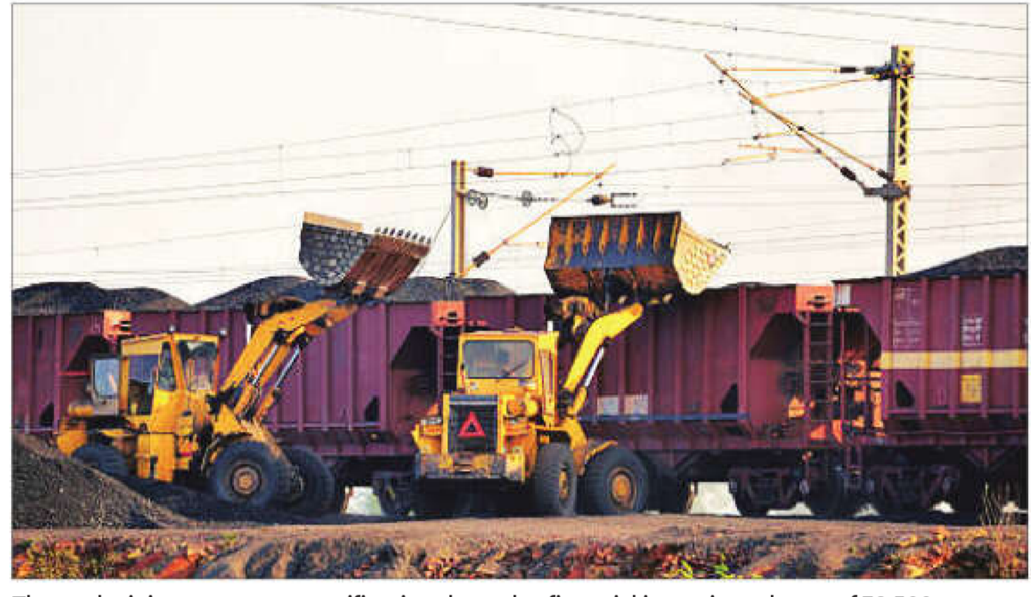
The coal ministry promotes gasification through a financial incentive scheme of ₹8,500 crore, with the goal of achieving 100 million tonne of coal gasification by 2030

Speaking during a roadshow on coal gasification in Mumbai, additional coal secretary Rupinder Brar said the coal ministry is in talks with the