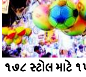
૧૭૮ સ્ટોલ માટે ૧૫૦૦ વેપારીઓ ક્યારનાં

રાજકોટ, તા. ૨૩ ૨૧જકોટ જિલ્લા વહીવટીતંત્ર દ્વારા આગામી તા. ૨૭ ઓગસ્ટથી પાંચ દિવસ સેમકોર્પ ગ્રાઉન્ડમાં આયોજિત કરાયેલા લોકમેળાના સમકાળના ૧૭૮ સ્ટોલ માટે સૌથી વધુ કામ ભરવાલા હોવા સમકાળના સ્ટોલના કાળા બજાર થવાની સંભાવના વ્યક્ત કરવામાં આવી રહી છે.