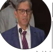
તેઓએ વધુમાં કહ્યું કે આખા સમસ્યને જોવાની જરૂર છે તેની સામે

મીડીયાએ સાચુ અને ખોટુ, સાડું અને ખરાબ, સાચુ અને બનાવટી તે અંતર દર્શાવવું જરૂરી છે