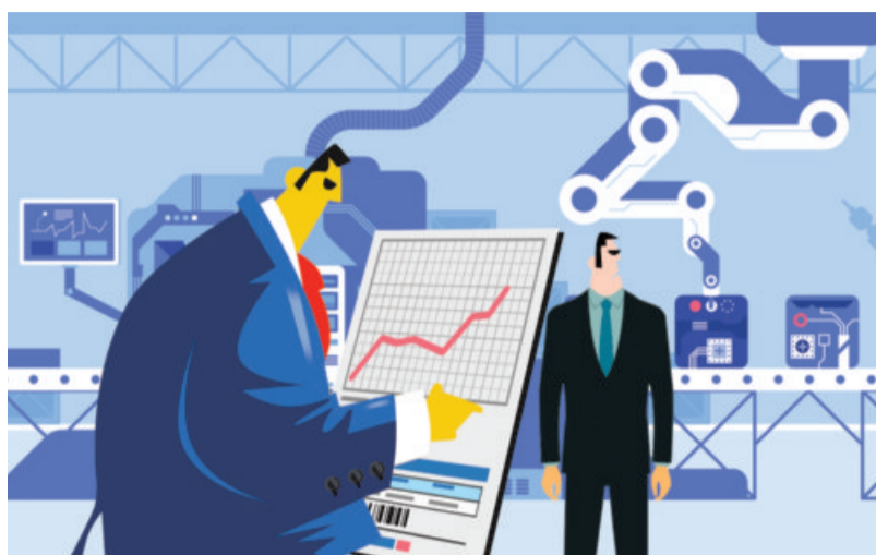
ILLUSTRATION: BINAY SINHA

Based on discussions on the specific road map to achieve the target, the upcoming report is expected to break down the target across various segments