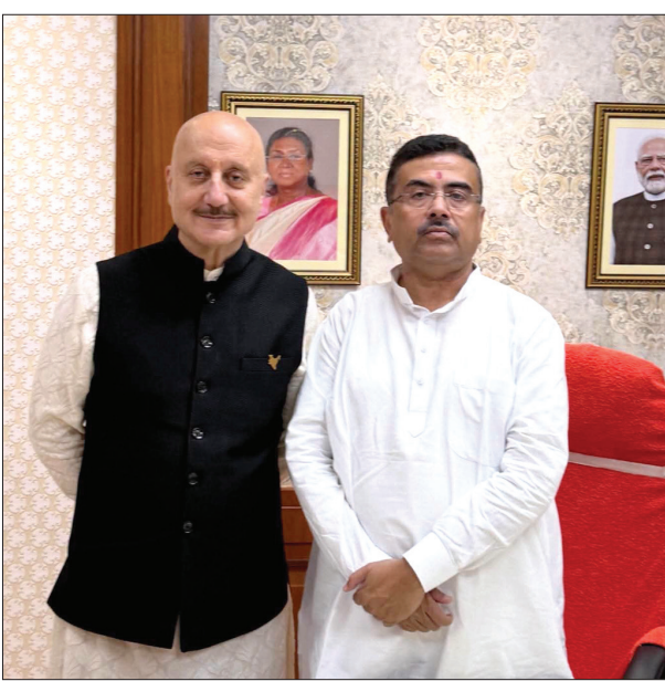
■ মুখ্যমন্ত্রী শুভেন্দু অধিকারীর সঙ্গে একাত্ম সাক্ষাৎকারে বলিউড অভিনেতা অনুপম খের। কলকাতায় শুক্রবার।