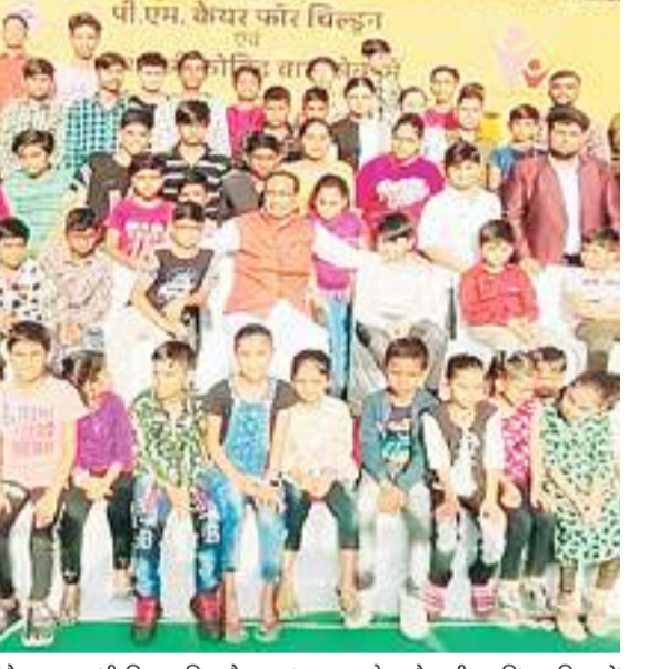
इंदौर। मुख्यमंत्री शिवराजसिंह चौहान मंगलवार को इंदौर की नरसिंह वाटिका में पीएम केयर फॉर बिल्डिंग एवं मुख्यमंत्री कोविड बाल सेवा के लाभार्थी बच्चों के संवाद कार्यक्रम शामिल हुए। उन्होंने बच्चों के साथ फोटो खिंचवाए।

कलेक्टर के निदेशों पर आंगनवाड़ियों तक पहुँचाया जाएगा। सीतला माता बाजार में बनाये गए मंच से सम्बोधित करते हुए मुख्यमंत्री चौहान ने कहा कि मैं अभिभूत हूँ, एक आह्वान पर इतनी सामग्री आ गई। वास्तव में इंदौर अद्भुत शहर है। मुख्यमंत्री चौहान ने संबोधन के दौरान कहा कि आंगनवाड़ियों के कई बच्चे अंडरवेट है, वो कुपोषण के शिकार है। यह सिर्फ आंगनवाड़ी कार्यकर्ताओं की जिम्मेदारी नहीं है, इसलिये समाज से आह्वान करने निकला हूँ। इंदौर की जनता से आह्वान है कि वे अपने जन्मदिन सालगिराह या किसी खुशी के अवसर पर कुपोषित बच्चों को दूध या केला खिलाये। साथ ही सक्षम जिले अन्य पिछड़े हुए जिलों के लिए सामग्री भेंट करें।