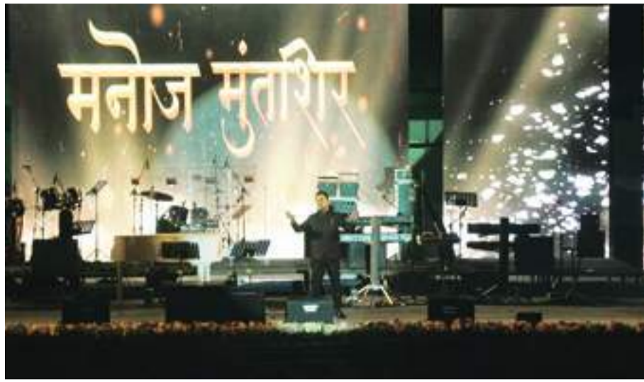
इंदौर गौरव दिवस पर समापन साताह पर नेहरू स्टेडियम में आयोजित मुख्य कार्यक्रम में सुप्रसिद्ध पार्थ गायिका श्रेया घोषाल ने अपने कथुर गीतों से समां बांधा। गीतकार मनोज मुंतशिर ने भी शानदार प्रस्तुति दी।