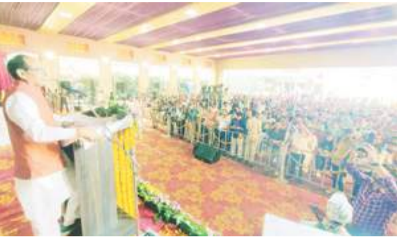
प्रदान की जाएगी, जब तक ये बच्चे किसी पद पर नहीं पहुंच जाते हैं।

उन्होंने कहा कि कोविड के कारण हमने अपनों को खो दिया और कई ऐसे बच्चे, जिन्होंने अपने माता-पिता को खो दिया, ऐसे बच्चे स्वयं को अनाथ न समझें, आपके शिवराज तो हैं। हमने तय किया है कि जिनके माता-पिता कोविड के कारण नहीं रहे, उन्हें पांच हजार रुपये प्रतिमाह दिए जाएंगे। यह राशि तब तक