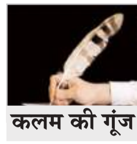
कलम की गूंज

प्रधानमंत्री मोदी के कार्यकाल में भारत ने खुद को एक ऐसे देश के रूप में स्थापित किया है कि यदि दुश्मन देश की तरफ आंख उठाकर भी देखेगा तो उसे ईंट का जवाब पत्थर से दिया जाएगा। उरी हमल के बाद सर्जिकल स्ट्राइक और बालाकोट हमले के बाद की गई एयर स्ट्राइक मोदी सरकार के ऐसे दो फैसले हैं। जिससे सरकार ने दुनिया को बता दिया कि यह पिछले जमाने का भारत नहीं बल्कि आधुनिक दुनिया का भारत है।