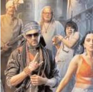
कार्तिक आर्यन और कियारा आडवाणी की फिल्म 'भूल भुलैया 2' बॉक्स ऑफिस पर 10 दिन बाद भी तगड़ा बिजनेस कर रही है। जिस दौर में एक