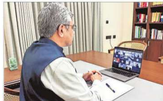
Union Minister Ashwini Vaishnaw witnesses the MoU signing in New Delhi on Friday