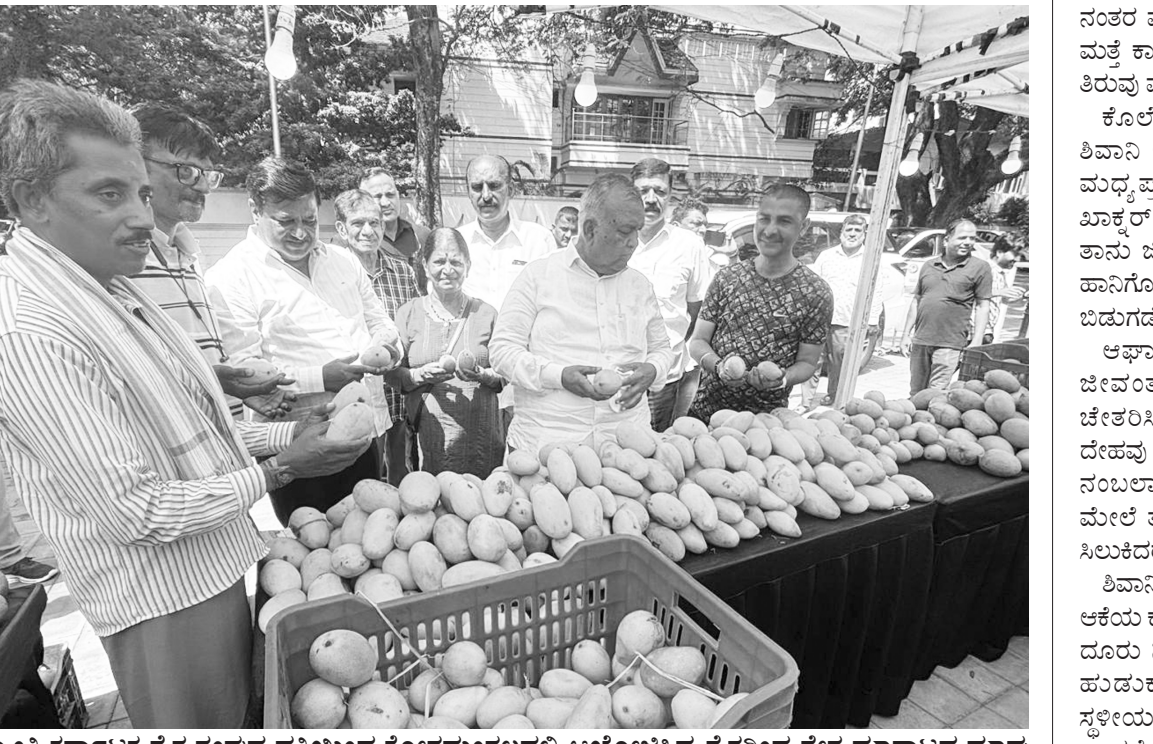
ಕ್ರಾಂತಿ ಕರ್ನಾಟಕ ರೈತ ಸಂಘದ ವತಿಯಿಂದ ಕೋರಮಂಗಲದಲ್ಲಿ ಆಯೋಜಿಸಿದ ರೈತರಿಂದ ನೇರ ಮಾರಾಟದ ಮಾವು ಮೇಳಕ್ಕೆ ಮಾಜಿ ಸಚಿವ ಹಾಗೂ ಶಾಸಕ ರಾಮಲಿಂಗಾರಡ್ಡಿ ಅವರು ಚಾಲನೆ ನೀಡಿದರು.