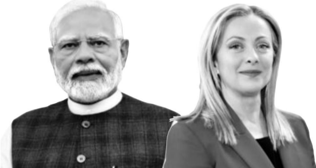
नरेंद्र मोदी और जॉर्जिया मेलोनी

भारत और इटली के संबंध अब एक निर्णायक दौर में पहुंच चुके हैं। हाल के वर्षों में दोनों देशों के रिश्तों में अभूतपूर्व तेजी से विस्तार हुआ है। ये संबंध केवल सौहार्दपूर्ण मित्रता तक सीमित नहीं रहे, बल्कि अब स्वतंत्रता और लोकतंत्र के मूल्यों तथा भविष्य के साझा दृष्टिकोण पर आधारित एक विशेष रणनीतिक साझेदारी में बदल चुके हैं। ऐसे समय में, जब पूरी दुनिया की व्यवस्था बड़े बदलाव के दौर से गुजर रही है, इटली और भारत की साझेदारी उच्च राजनीतिक और संस्थागत स्तर पर लगातार संवाद से आगे बढ़ रही है। यह संबंध अब एक नए और अधिक व्यापक स्तर पर पहुंच रहा है, जिसमें दोनों देशों की आर्थिक ताकत, सामाजिक रचनात्मकता और हजारों वर्षों पुरानी सभ्यतागत विरासत शामिल है।