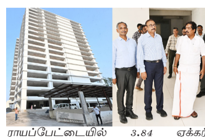
ராயப்பேட்டையில் 3.84 ஏக்கர் பரப்பளவில் 17 அடுக்குமாடி கொண்ட 8,10,700 ச.அடியில்

சென்னை, மே. 22-முதலமைச்சர் ஜோசப் விஜய் உத்தரவின்படி வீட்டுவசதி மற்றும் நகர்ப்புற வளர்ச்சித் துறை அமைச்சர் ப.ராஜ்குமார் சென்னை ராயப்பேட்டையில் வீட்டு வசதி வாரியத்தால் கட்டப்பட்டு வரும் வணிக வளாகத்தை பார்வையிட்டு ஆய்வு செய்தார். பின்னர் அமைச்சர் ப.ராஜ்குமார் தெரிவிக்கையில், தமிழ்நாடு வீட்டுவசதி வாரியத்தால் சென்னை