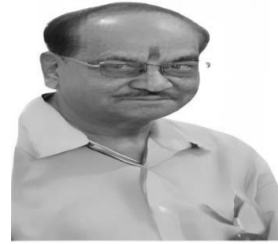
Dr. Ravi Chaturvedi

The Indian hockey team put up against odds and went on with commitment and conviction to claim back-to-back Olympic Hocket bronze medal. It was shocking when ace India defender Amit Rohidas was shown red card in the Olympic quarter-final match against Great Britain. Rohidas, an important cobweb in defence and feeding forwards in their surge towards opponent's goalmouth was sadly missed in the semifinal against Germany. However, in the play-off against Spain for the Bronze medal, skipper Harmanpreet, Srijesh and Amit are to be lauded for their resilience and grit to overcome a mounting challenge from Spain in the closing stages of the game.