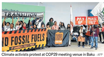
Climate activists protest at COP29 meeting venue in Baku

by almost 1%. Scientists say these emissions need to fall by 42% by the end of this decade to avoid a global temperature rise in excess of 1.5C, considered the threshold to far more dangerous impacts than we are seeing at present.