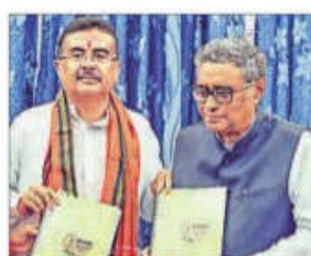
CM Suwendu Adhikari, accompanied by state Finance Minister Swapan Dasgupta (right) at the West Bengal Legislative Assembly House, in Kolkata on Monday

The Eight Core Industries comprise 40.27% of the weight of items included in the Index of Industrial Production (IIP).