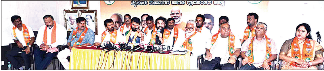
ದ್ವಿಪಕ್ಷದ ಬಹುಮತದಿಂದ ಹುನ್ನಾರ (ಸಂವಿಧಾನ) ಅಧ್ಯಕ್ಷರು

ಹೈಕೋರ್ಟ್‌ನಲ್ಲಿರುವ ಪ್ರಕರಣ ತೆರವಿಗೆ ಸರ್ಕಾರ ಮುಂದಾಗಬೇಕೆಂದು ಆಗ್ರಹ